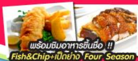
พร้อมชิมอาหารขึ้นชื่อ !! Fish&Chip+เบียร์ Four Season